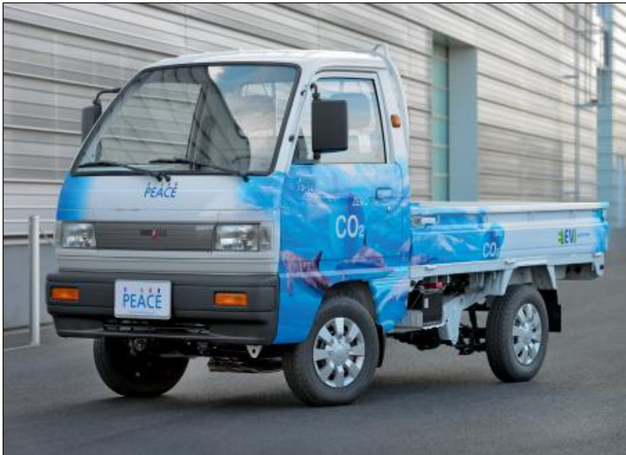
Bild „4094_59_B“ zu Presseinformation 27a-2013 vom 26. November 2013

Kostengünstig und emissionsfrei auf den Straßen von Seoul: Der Elektrokleinlaster „Peace“ der koreanischen Firma Power Plaza fährt mit einem eco-Kit M aus dem Hause Linde Material Handling.